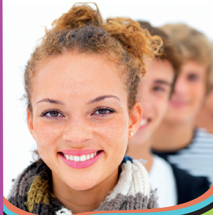
juillet 2010 - photos : © Yuri Arcurs - www.agap-je.com

Un dispositif destiné à favoriser une démarche d'insertion sociale et professionnelle des jeunes en difficulté.