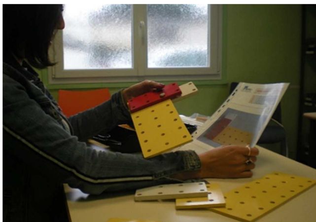
L'atelier réalisation de montages