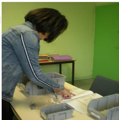
L'atelier préparation de commandes